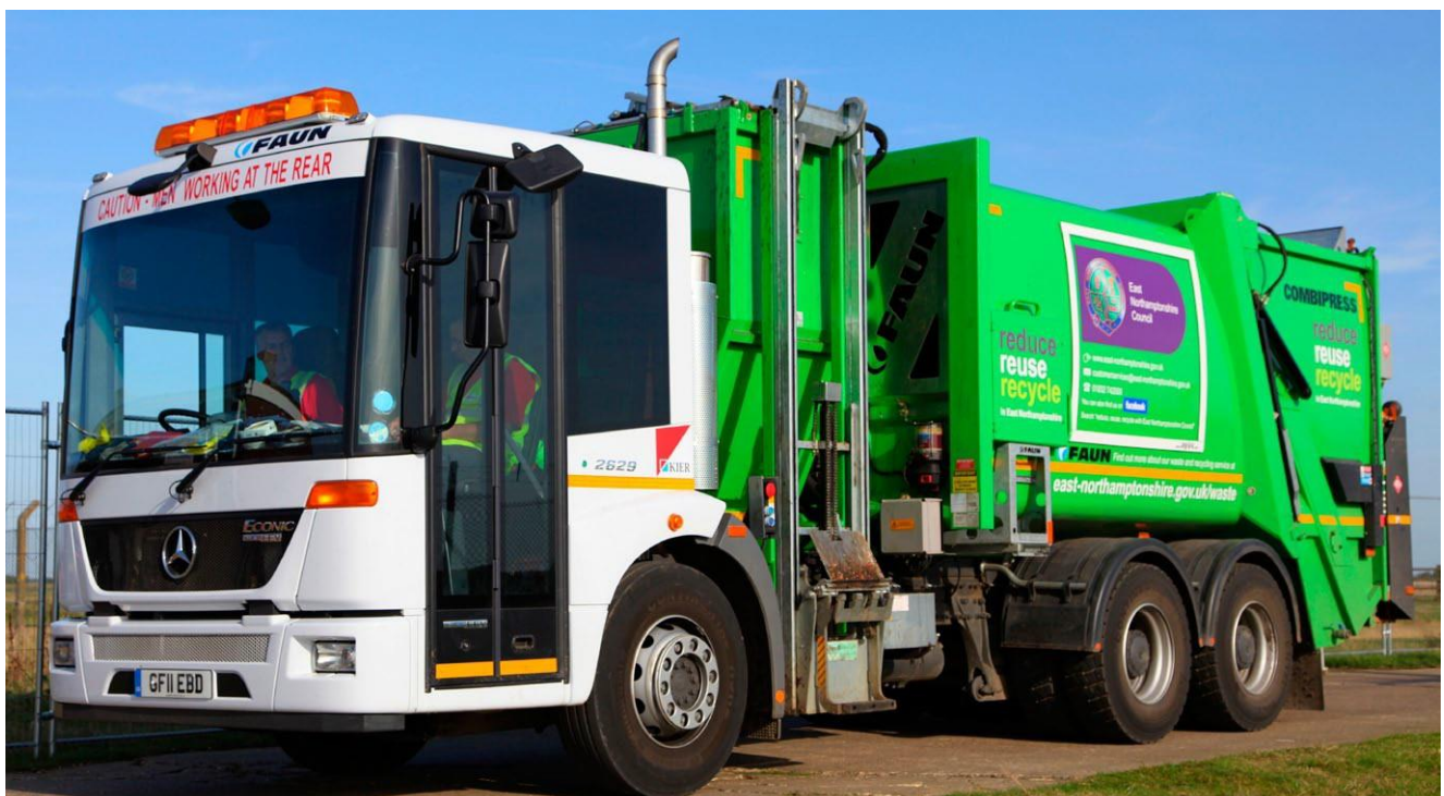
Kier Environmental's one pass collection vehicles with side loading food pods.

die Anwendung der Routenoptimierungssoftware RouteSmart von Integrated Skills. Für die 6 Fahrzeuge wurden Recycling- und Abfallsammelfahrten berechnet, optimiert und abgeglichen. Dabei wurden sowohl die städtischen als auch die ländlichen Gebiete im gesamten Bezirk East Northamptonshire berücksichtigt. Ein neuer Abfallkalender wurde bereitgestellt. Über eine interaktive Karte kann sich nun jeder Kunde individuell über den Entsorgungsplan an seiner Adresse informieren.